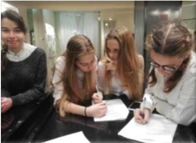
Народный музей «А музы не молчали...»