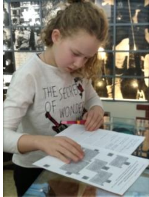
Народный музей «Дети и дошкольные работники осажденного Ленинграда»