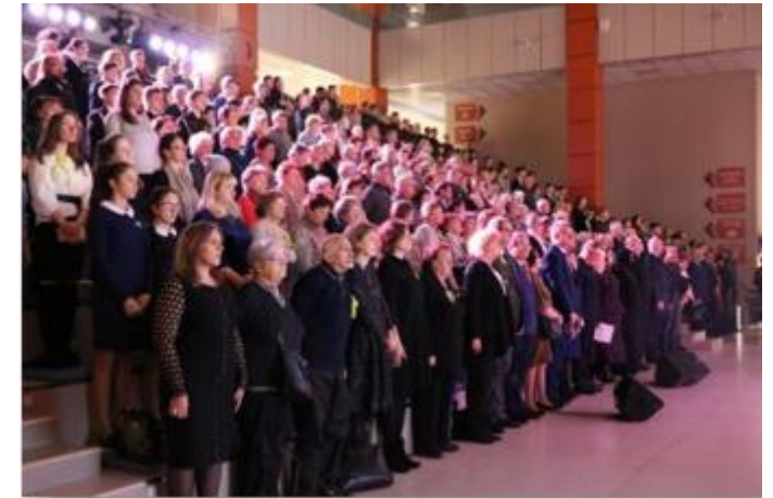
Исторический парк «Россия - Моя история»