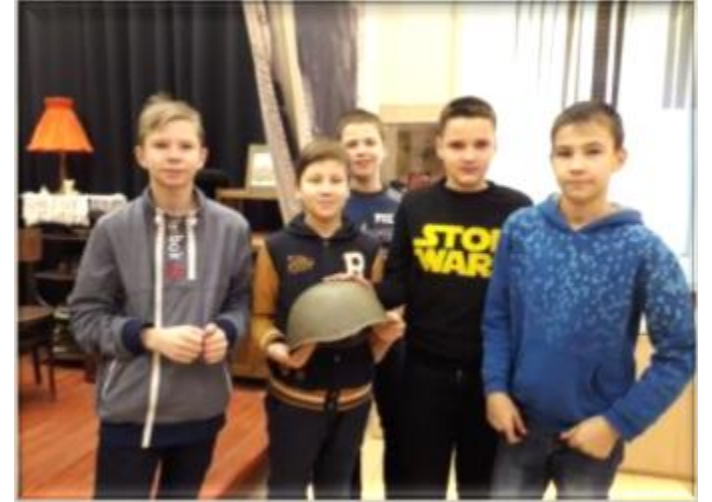
Музей-библиотека «Книги блокадного города»