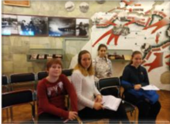
Государственный музей истории Санкт-Петербурга» (филиал музей «Особняк Румянцева»)