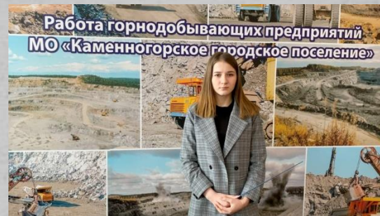
Экскурсовод школьного музея Нечкина К.. Ученица 11 класса