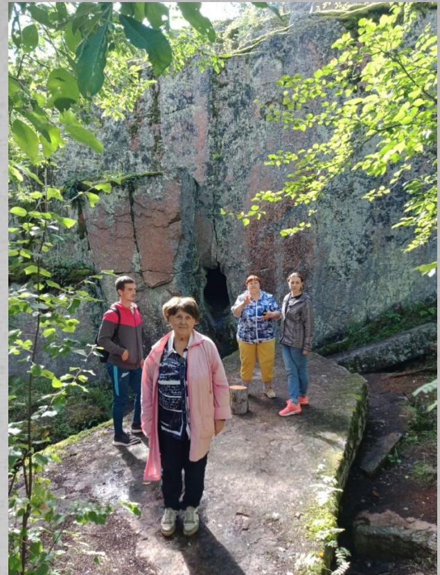
Группа туристов на экскурсии, организованной совместно с НП «Лосевский курорт»