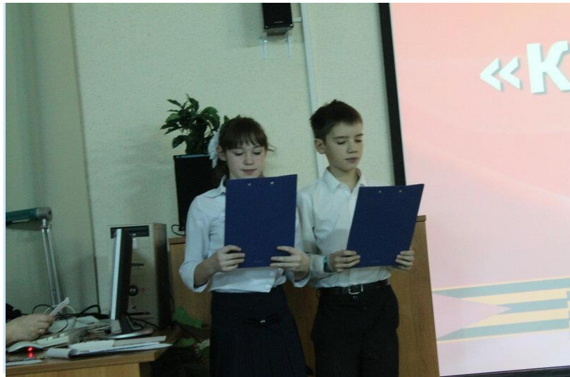
1 класс. Тема доклада посвящена учителям-предметникам школы