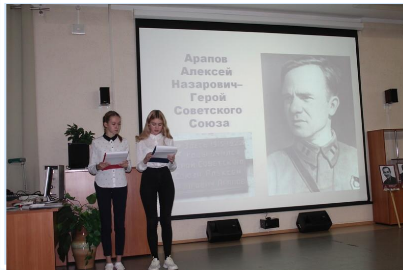
2017 г. Малые Новоуральские краеведческие чтения

Всероссийская с международным участием научно-практическая конференция, посвященная перспективам развития детско-юношеского туризма и краеведения «КОЛПИНСКИЕ ЧТЕНИЯ ПО КРАЕВЕДЕНИЮ И ТУРИЗМУ» 25 марта 2021 г.