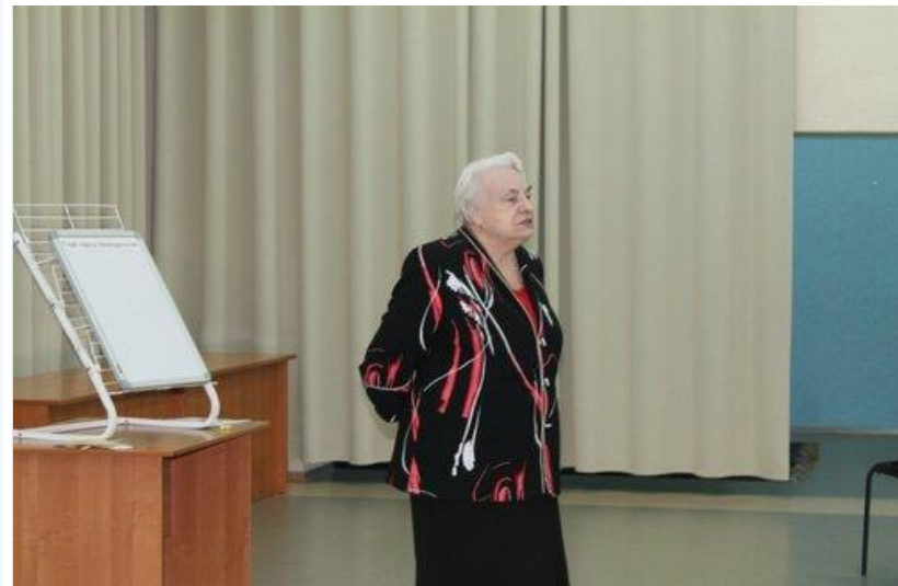
Почетные гости конференций

Всероссийская с международным участием научно-практическая конференция, посвященная перспективам развития детско-юношеского туризма и краеведения «КОЛПИНСКИЕ ЧТЕНИЯ ПО КРАЕВЕДЕНИЮ И ТУРИЗМУ» 25 марта 2021 г.