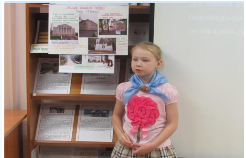
Учащийся детского сада рассказывает про улицы города

Всероссийская с международным участием научно-практическая конференция, посвященная перспективам развития детско-юношеского туризма и краеведения «КОЛПИНСКИЕ ЧТЕНИЯ ПО КРАЕВЕДЕНИЮ И ТУРИЗМУ»