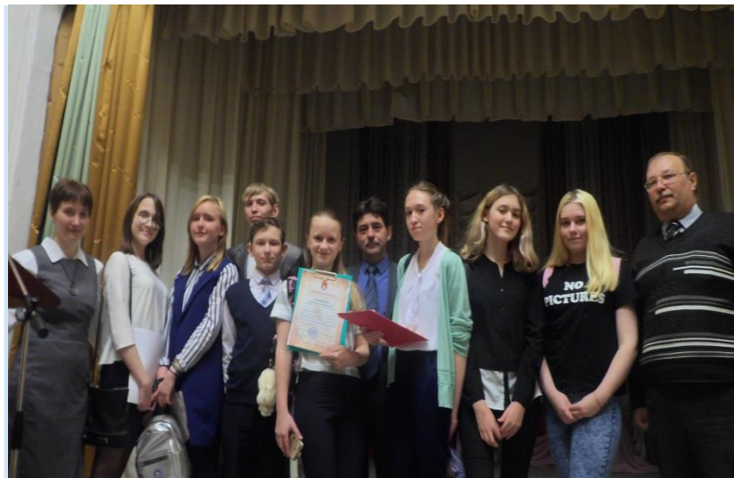
2017 г. Первые Верх-Нейвинские чтения