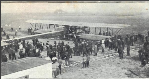
«Русский Витязь» — новый грандиозный русский аппарат, изобретенный великим конструктором-летчиком П. И. Сидором и построенный под его наблюдением на Русско-Балтийской заводе. «Русский Витязь», первоначально называвшийся «Гладиус» («Большой Балтийский»), взлетает с места на Корпусном аэродроме, под Петербургом.