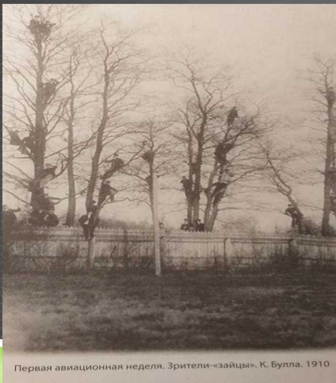
Фото 1910 года