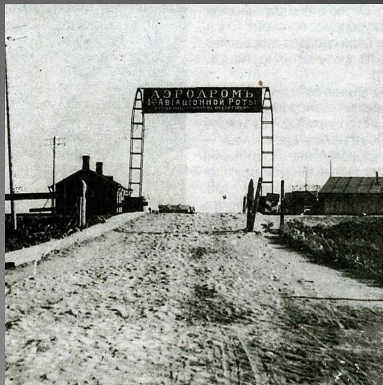
Фото 1913 года