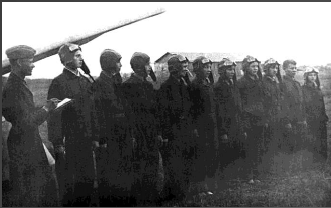
Строевая подготовка 1939 год, Построение учебных полётов аэроклуба Ленинградского областного совета Осоавиахима на Корпусном аэродроме