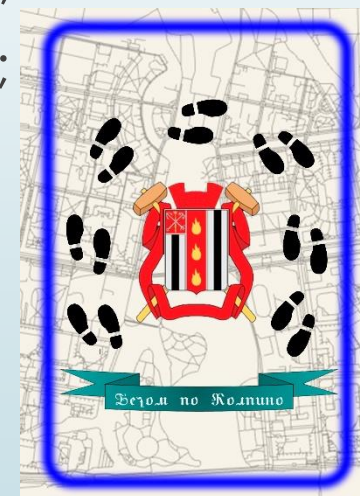
На улицах славных