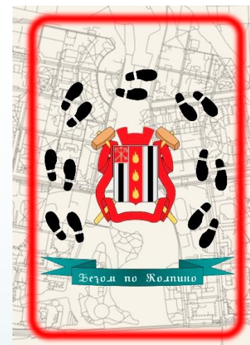
Город Воинской славы